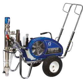
DUTYMAX™ EH230DI STANDARD