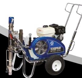
DUTYMAX™ GH300DI STANDARD