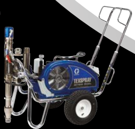
DUTYMAX™ EH300DI STANDARD