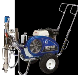
DUTYMAX™ GH230DI STANDARD